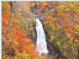
秋保大滝(詳細は26ページ-A1)

工房・クラフトに触れ、体験ができる秋保エリアは、美しい名取川に沿って様々なものづくりを営む人が集まる「クラフトバレー」の地。手しごとならではの温かみや丁寧な仕事ぶりを感受することができる秋保エリアに、ぜひ訪れてみてください。