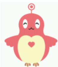
仙台市障害理解促進キャラクター 「ココロン」