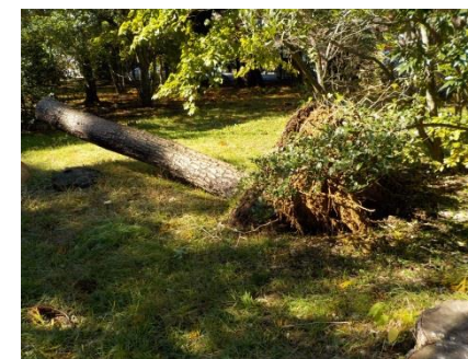
写真8 ④本丸跡倒木の1本（マツ）