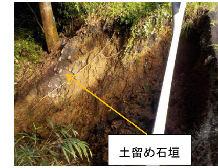
写真6 ④本丸西部市道法面道路際