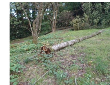
写真9 ③造酒屋敷跡枯木倒木