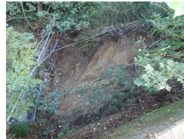
写真3 ②五色沼西側崖面崩落状況