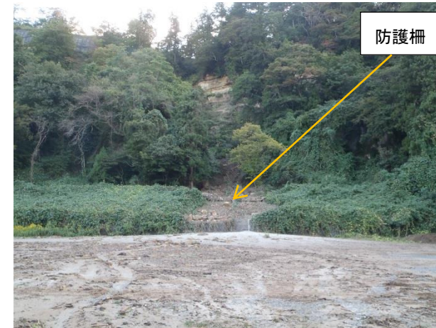
写真1 ①本丸東側崖面崩落全景