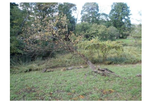
写真10 ③二の丸堀跡倒木