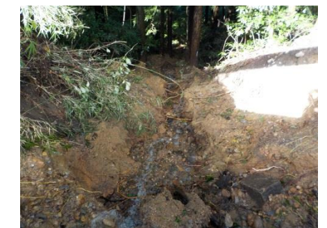
写真7 ④本丸西部市道法面谷側