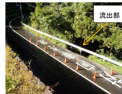
写真5 ④本丸西部市道法面流出