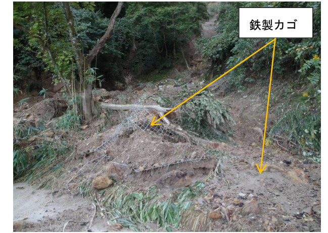
写真2 ①本丸東側崖面崩落斜面下部