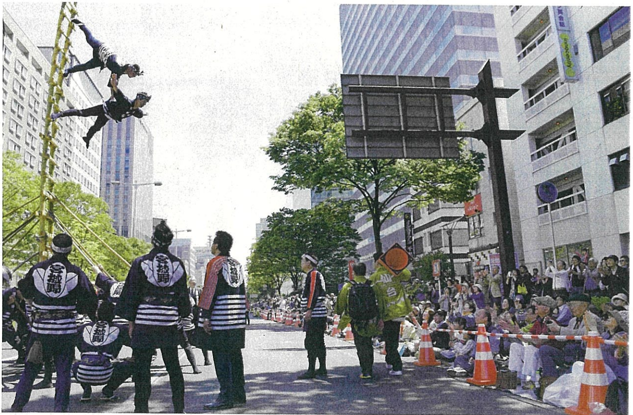
仙台・青葉まつりでの披露（平成 28 年 宮城野消防団階子乗り隊）