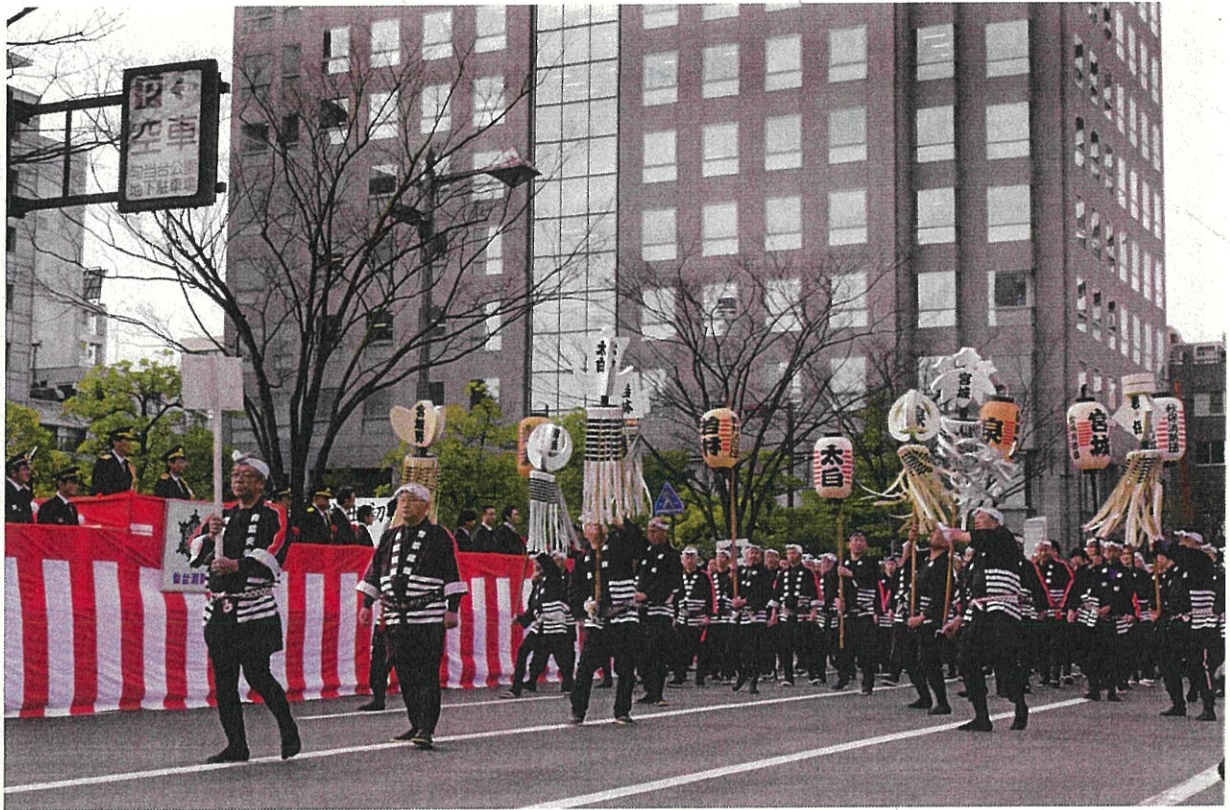
仙台市消防出初式での観閲行進（平成 28 年）