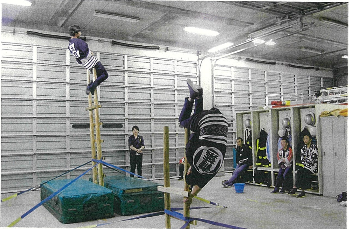
乗り手合同訓練（平成 27 年 秋保出張所）