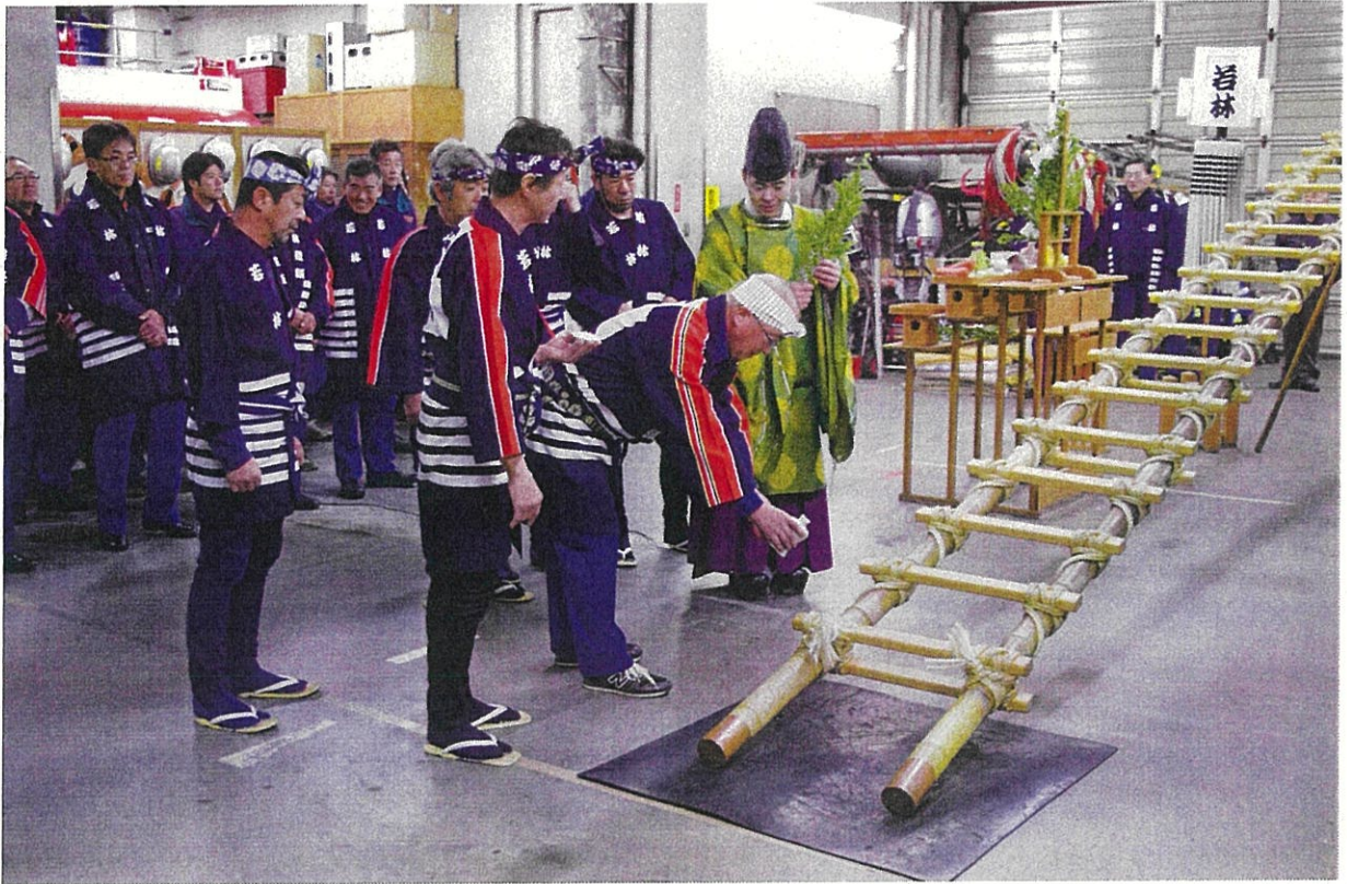
安全祈願祭（平成 27 年 若林消防団階子乗り隊）