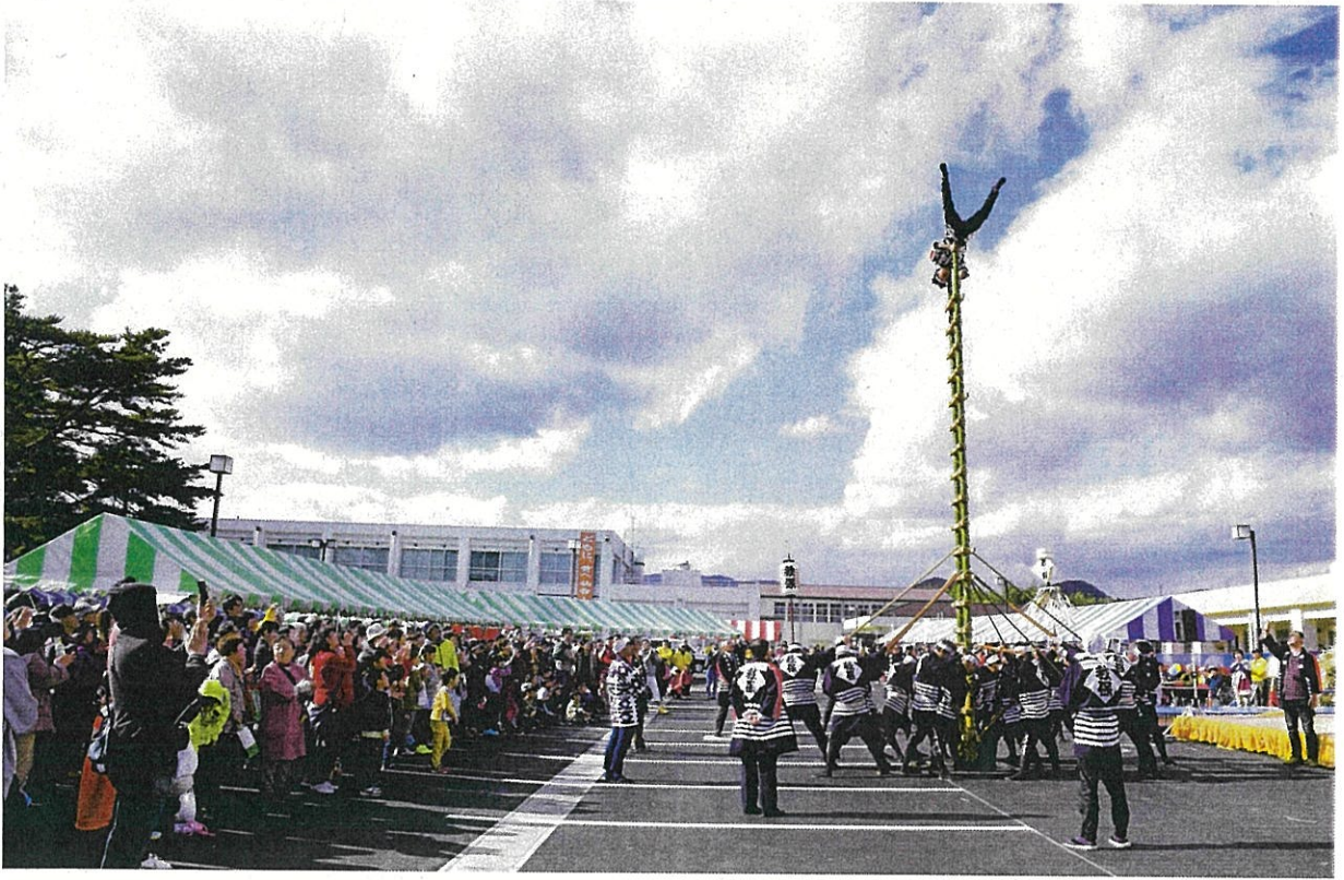
地域のまつりでの演技披露（平成 28 年 秋保消防団階子乗り隊）