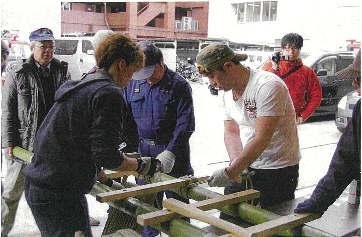
梯子の縄締め（平成 27 年 青葉消防団階子乗り隊）