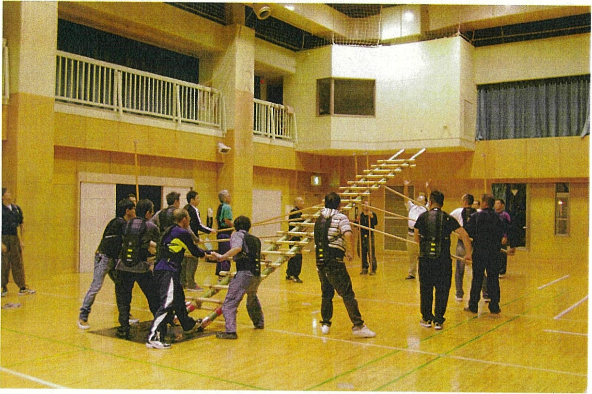
事前訓練（平成 27 年 泉消防団階子乗り隊）