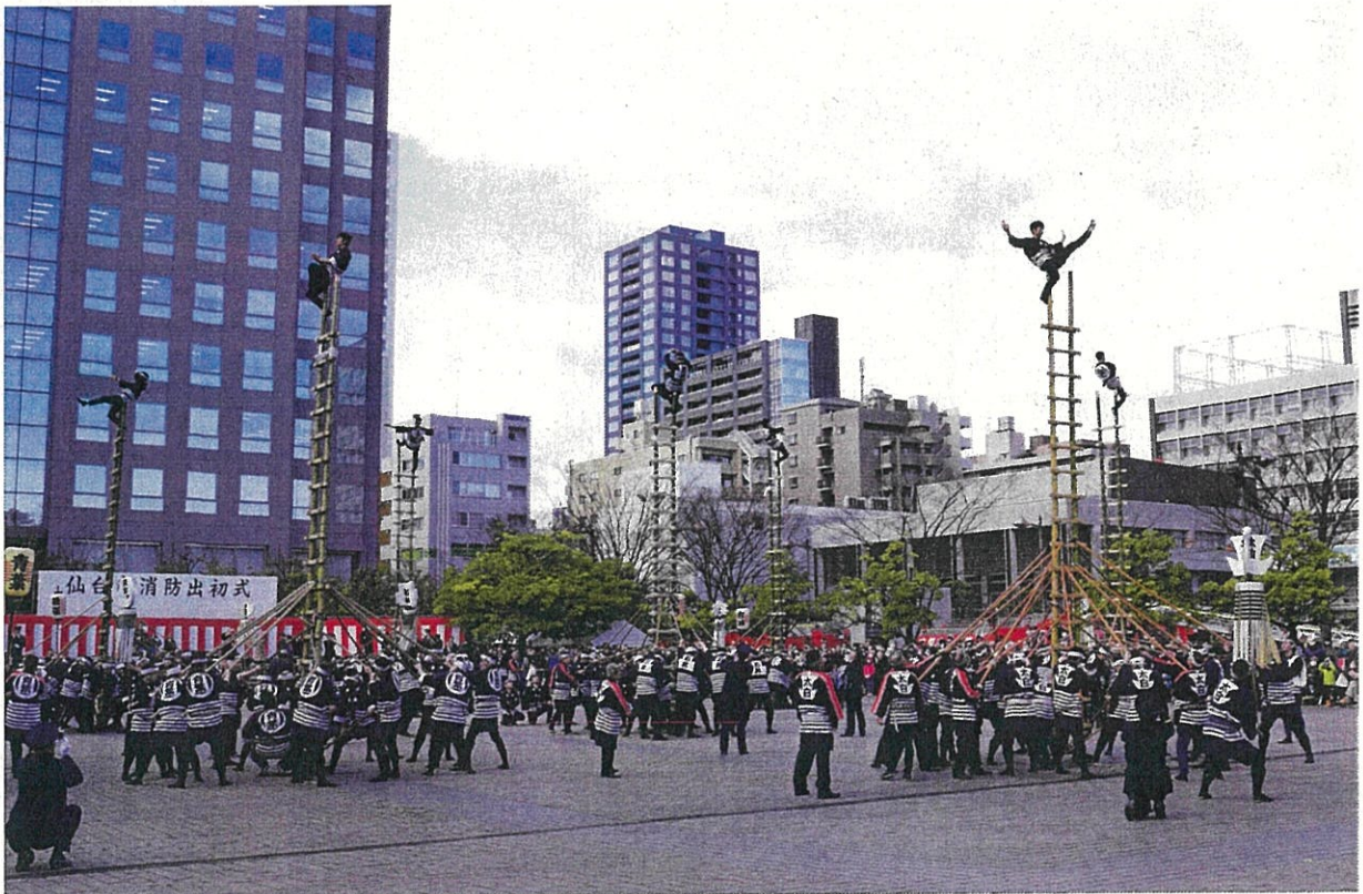
仙台市消防出初式での7隊の演技（平成 29 年）