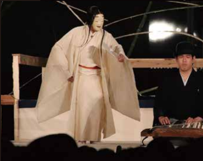
2019年小金井薪能「雨ニモマケズ」