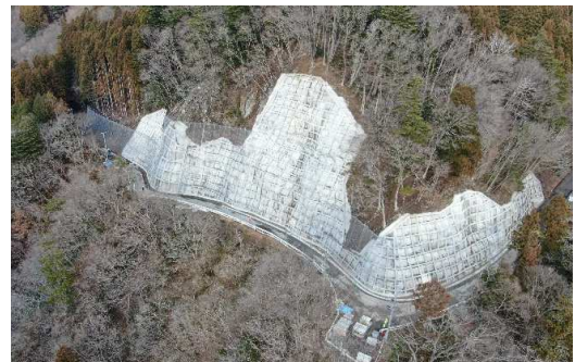
災害復旧工事（上空より）