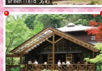
秋保木の家 珈琲館