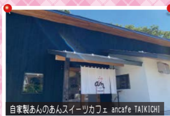
自家製あんのかんスイーツカフェ ancafe TAIKICHI