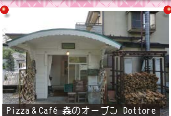
Pizza & Café 森のオープン Dottore