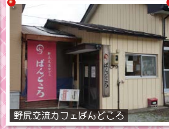
野尻交流カフェばんどころ