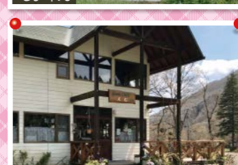
Green field えむ