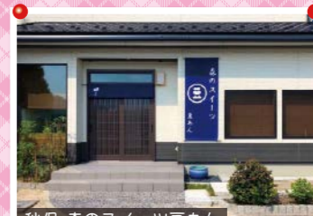
秋保 森のスイーツ巨あん