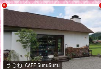
うつわ CAFE GuruGuru