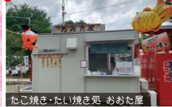
たこ焼き・たい焼き処 おおた屋