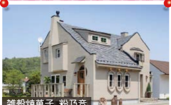
雑穀焼菓子 粉乃音