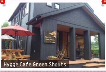
Hygge Cafe Green Shoots