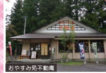
おやすみ処不動産