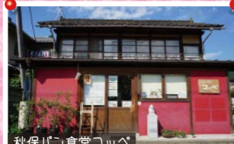
秋保パコ食堂コッペ