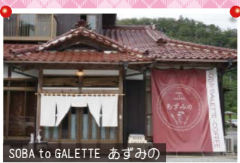
SOBA to GALETTE あずみの