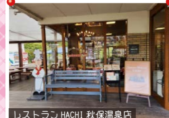
レストラン HACHI 秋保温泉店