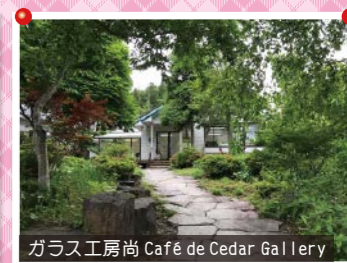
ガラス工房尚 Café de Cedar Gallery