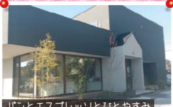
パコとエスプレッソとひとやすみ