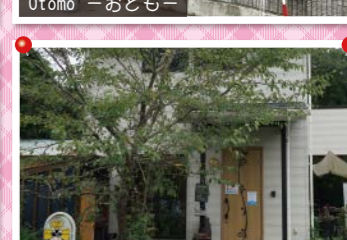
Kukka with Flower & Cafe