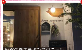
秋保の森工房ボンスヴニール