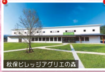
秋保ビレッジアグリエの森